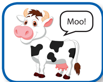
Sing a Song 6-12 months