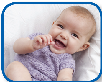
Hablar con sonrisas De 3 a 6 meses