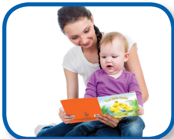
Lea un libro De 3 a 12 meses