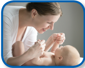
Jugar con los sonidos De 0 a 3 meses